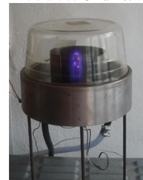
Niturare cu Grilă Activă